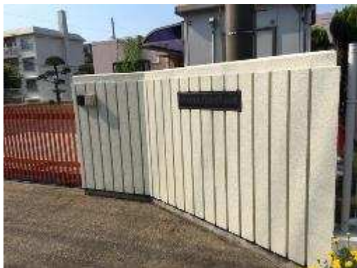
調査（附属幼稚園外壁）